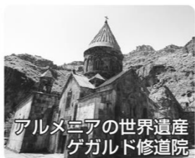
アルメニアの世界遺産 ゲガルド修道院

●調べていて寺平は行きたくなくてしまいましたあ！ 行った事のある方は実際どんな所だったか教えて下さ〜い♪